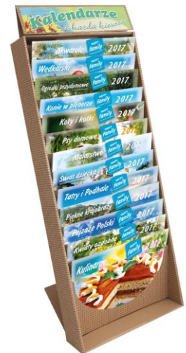
Zestaw Sklepowy ZS 2 WL w ekspozytorze kartonowym.