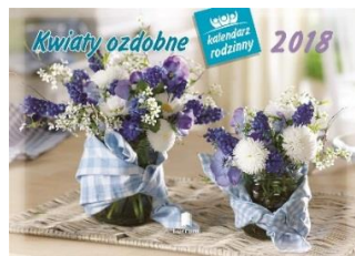
WL 2 Kwiaty ozdobne