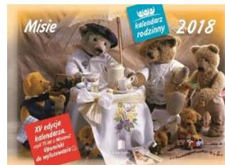
WL 6 Misie