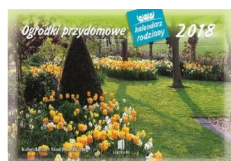
WL 11 Ogródki przydomowe