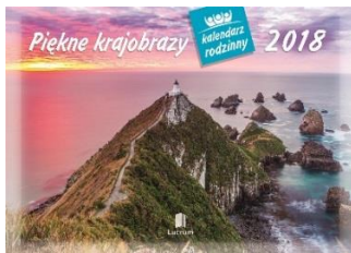
WL 4 Piękne krajobrazy