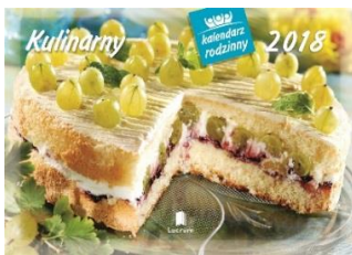
WL 1 Kulinarny