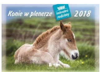
WL 10 Konie w plenerze