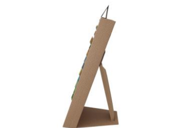
Ekspozytor – widok z boku.