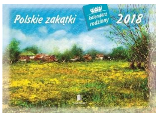
WL 7 Polskie zakątki