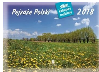
WL 3 Pejzaże Polski