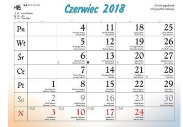
Kalendarz po rozłożeniu