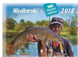
WL 12 Wędkarski