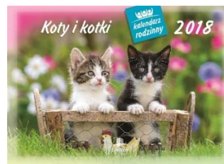
WL 9 Koty i kotki